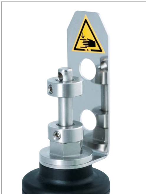
Edelstahlhalter für Näherungsinitiatoren